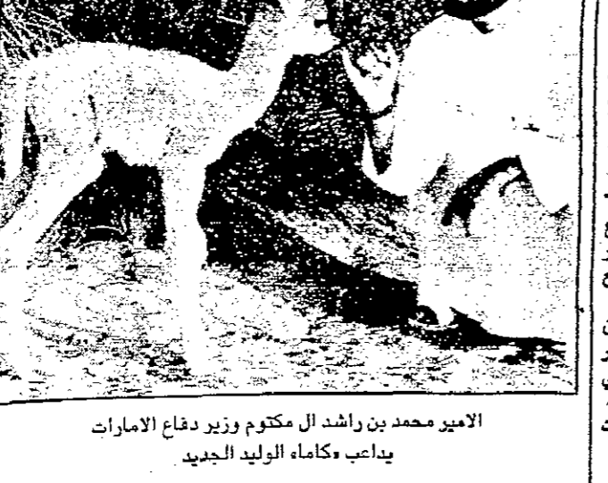
الأمير محمد بن راشد آل مكتوم وزير دفاع الإمارات يداعب وكاماء الوليد الجديد